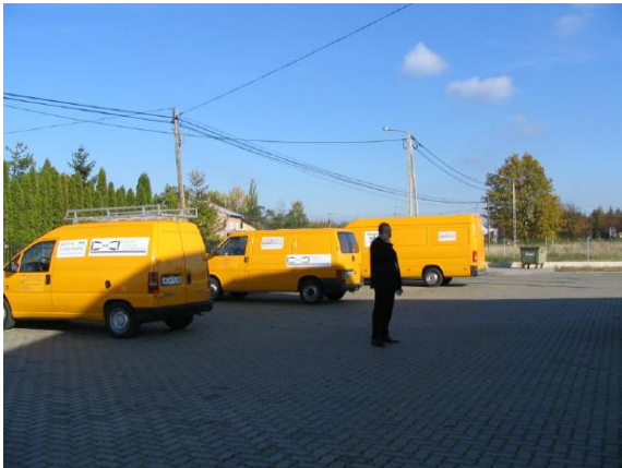
Ogólnopolski serwis techniczny

MARPOL – Twój partner w technologiach bezwykopowych o 25-letnim doświadczeniu