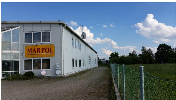
Obsługa handlowa a administracyjna