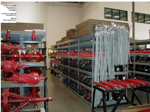
Części zamienne dostępne w kraju od producenta